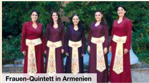
Frauen-Quintett in Armenien