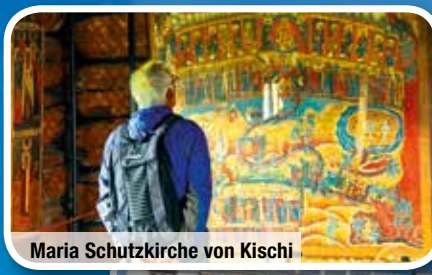
Maria Schutzkirche von Kisch