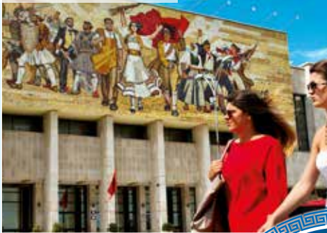
Nationalmuseum in Tirana