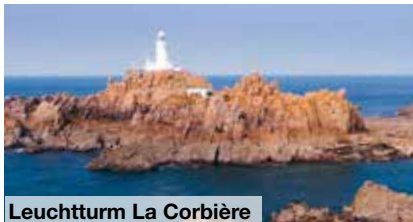
Leuchtturm La Corbière

Bei diesem inklusiven Ganztagesausflug erleben Sie Fischertradition in der familiengeführten Faulkner Fisheries, wo Sie Schätze des Meeres wie z. B. Austern (saisonal) verkosten. Dann erwartet Sie die Burgruine Grosnez