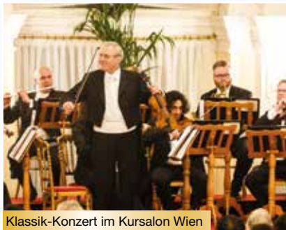
Klassik-Konzert im Kursalon Wien

Mit dem Fernreisebus fahren Sie heute nach Wien, wo Sie Ihr 4-Sterne-Hotel erwartet. Wir empfehlen Ihnen, vor Ort ein Paket bestehend aus zwei Abendessen zu buchen, das mit Erlebnissen wie Einkehr in einem „Heurigen“ und Prater-Besuch mit Riesenradfahrt gewürzt ist.