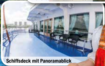
Schiffsdeck mit Panoramablick