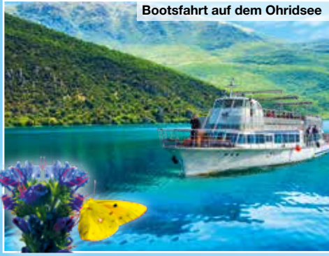
Bootsfahrt auf dem Ohridsee