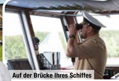
Auf der Brücke Ihres Schiffes