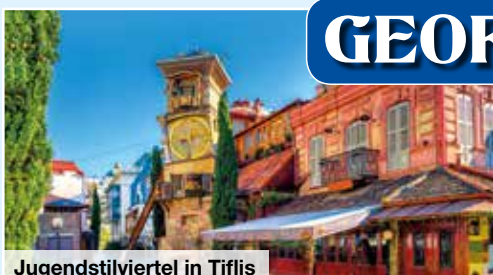
Jugendstilviertel in Tiflis