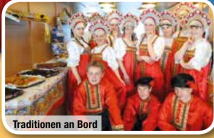
Traditionen an Bord