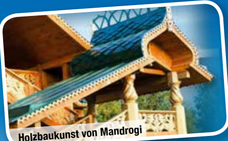
Holzbaukunst von Mandrogi

Visum- und Konsulatsgebühren € 102 p. P. (Stand Juli 2019 – Änderungen möglich)