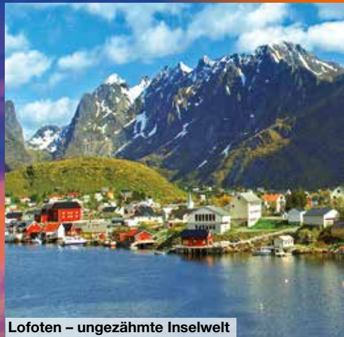
Lofoten – ungezähmte Inselwelt

Höhepunkte: Fahrt durch die Naturidylle Smålands in Schweden, Stadtbesichtigung in Stockholm mit örtlichem Reiseführer, Übernachtung an Bord der MS Galaxy und nächtliche Überfahrt durch das Schärenmeer nach Turku in Finnland.