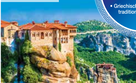
Klöster von Meteora