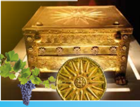
Grabkammer von Philipp II.