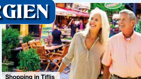
Shopping in Tiflis