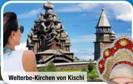
Walterbe-Kirchen von Kisch