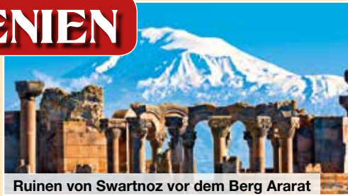
Ruinen von Swartnoz vor dem Berg Ararat