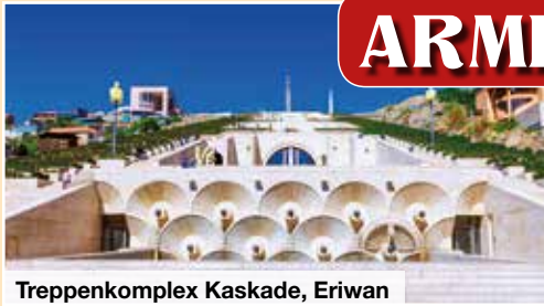
Treppenkomplex Kaskade, Eriwan