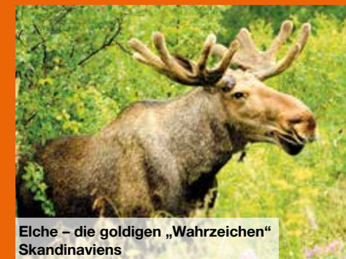
Elche – die goldigen „Wahrzeichen“ Skandinaviens