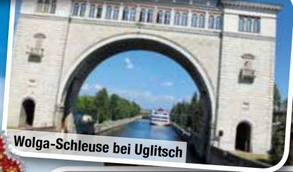
Volga-Schleuse bei Uglitsch