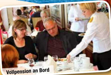
Vollpension an Bord